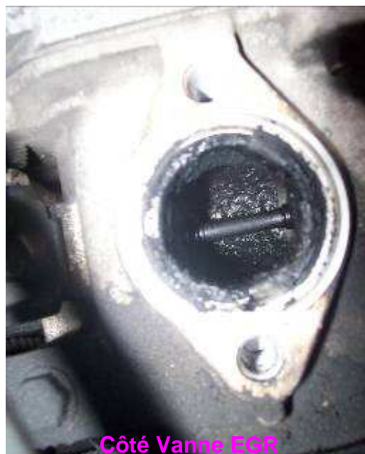
Côté Vanne EGR