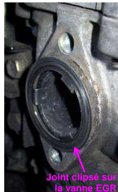
Joint clipsé sur la vanne EGR