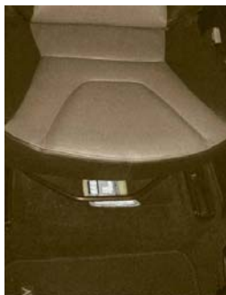
Emplacement de la plaque constructeur sous le siège passager avant

Sous le siège passager avant, en soulevant la moquette vous trouverez deux plaques métalliques reprenant le pedigree de votre véhicule.